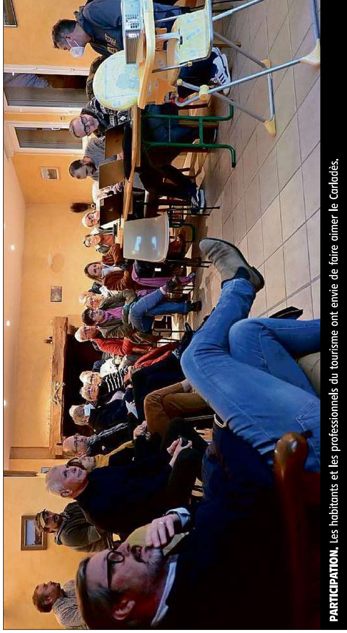
PARTICIPATION. Les habitants et les professionnels du tourisme ont envie de faire aimer le Carladès.

De nombreux intervenants du Carladès se sont emparés des thématiques de travail proposées par l'office inter-communal de tourisme, afin de donner un nouvel élan touristique au territoire.