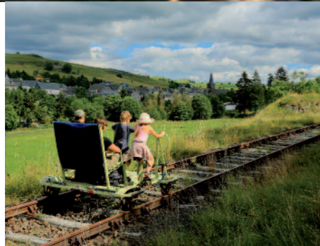
Vélorail du Cézallier à Allanche