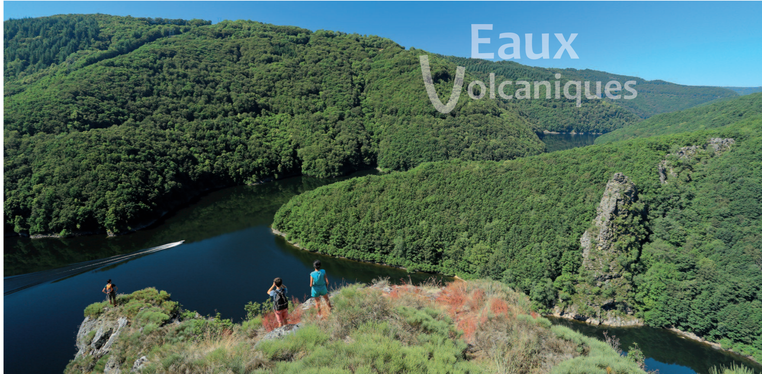
Canoë sur la Sioule