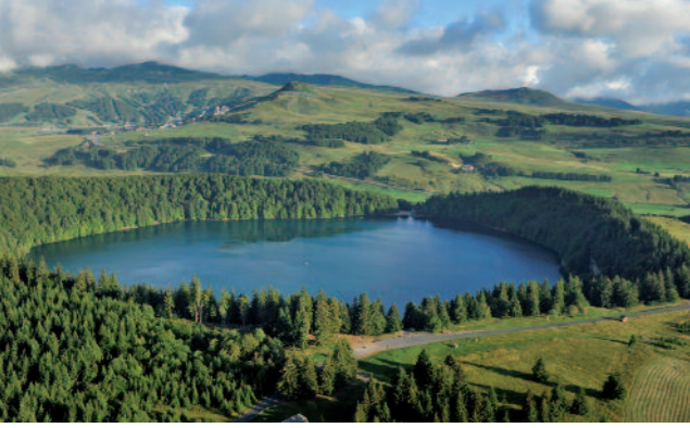
Lac Pavin dans le Sancy