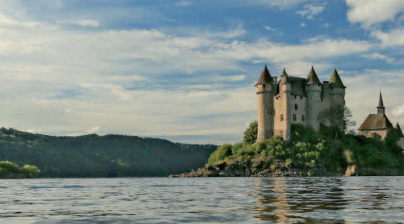
Château de Val - Plage et base nautique de Val à Lanobre

Des lacs de cratère, cercles parfaits aux eaux claires et profondes (Pavin, Servières, Godivelle, Gour de Tazenat) aux grands lacs aménagés pour la baignade et les activités nautiques (Aydat, Chambon, Cantalès, Enchanet et Garabit-Granval), les lacs d’Auvergne surprennent par leur diversité et se prêtent à toutes les envies.