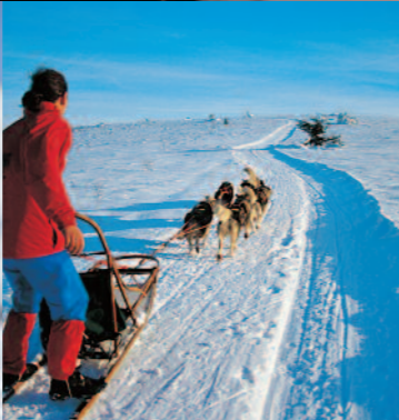
Domaine nordique du Forez