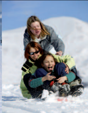
Station de Chastreix-Sancy