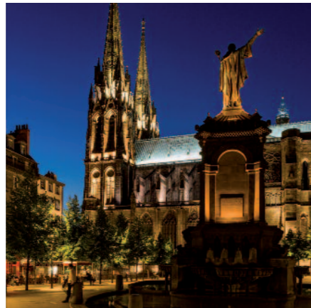
Cathédrale de Clermont-Ferrand

Vivantes, surprenantes et chargées d'histoire, les villes d'Auvergne font battre le cœur de cette terre de nature et de grands espaces. On y goûte, le temps d'une escale ou d'un séjour, la douceur de vivre, les riches traces de l'Histoire, les bonnes tables, et de nombreux événements culturels tout au long de l'année. A Clermont-Ferrand, en flânant le long des rues piétonnes du centre historique, vous ne pourrez pas manquer la singulière cathédrale gothique en lave anthracite qui domine la ville de son imposante stature. Au détour d'une ruelle, découvrez la basilique romane de Notre-Dame-du-Port, inscrite au patrimoine mondial de l'UNESCO, avant de vous faire conter l'histoire industrielle de la ville à L'Aventure Michelin. Aurillac possède quant à elle bien des secrets à révéler aux