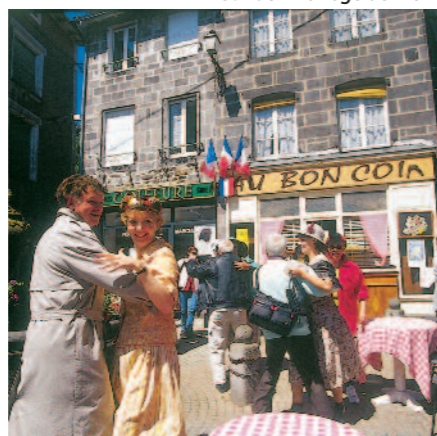
Festival des Hautes Terres à Saint-Flour