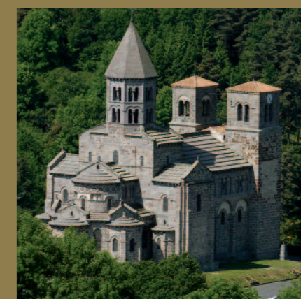
Église de Saint-Nectaire