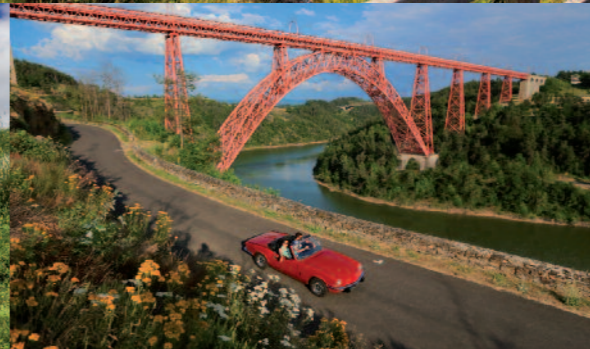
Viaduc de Garabit - Gustave Eiffel

2000 km de GR (GR4, GR400, GR441, GR465, ...) GTMC Grande Traversée du Massif Central - VTT Via Arverna Chemin de Saint-Jacques Route des Fromages AOP d'Auvergne Romain Bardet Expérience 39 boucles cyclosporives Circuits auto et Moto Route des châteaux 1 400 km de pistes équestres 9 sites VTT labellisés FFC