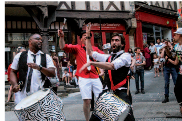
Festival la Pamparina à Thiers