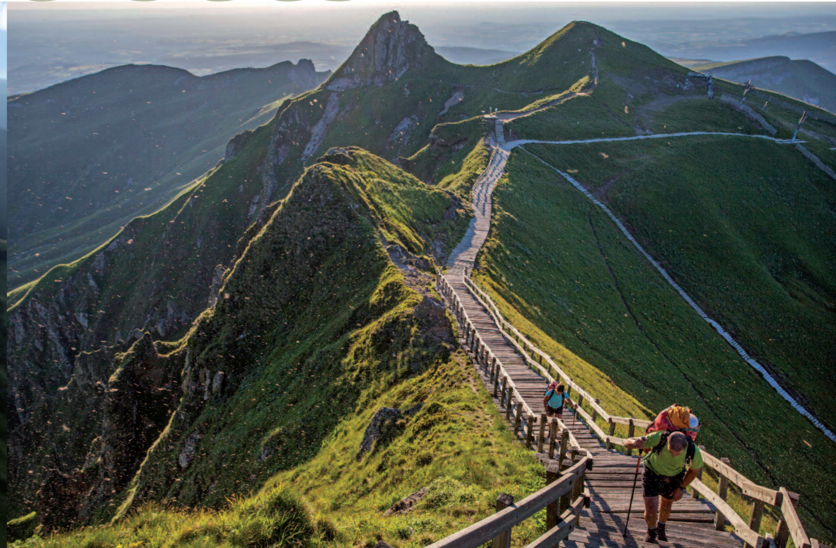
Puy de Sancy - 1 885 m