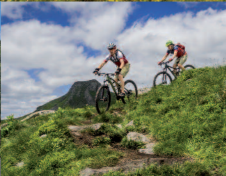
VTT dans le Sancy