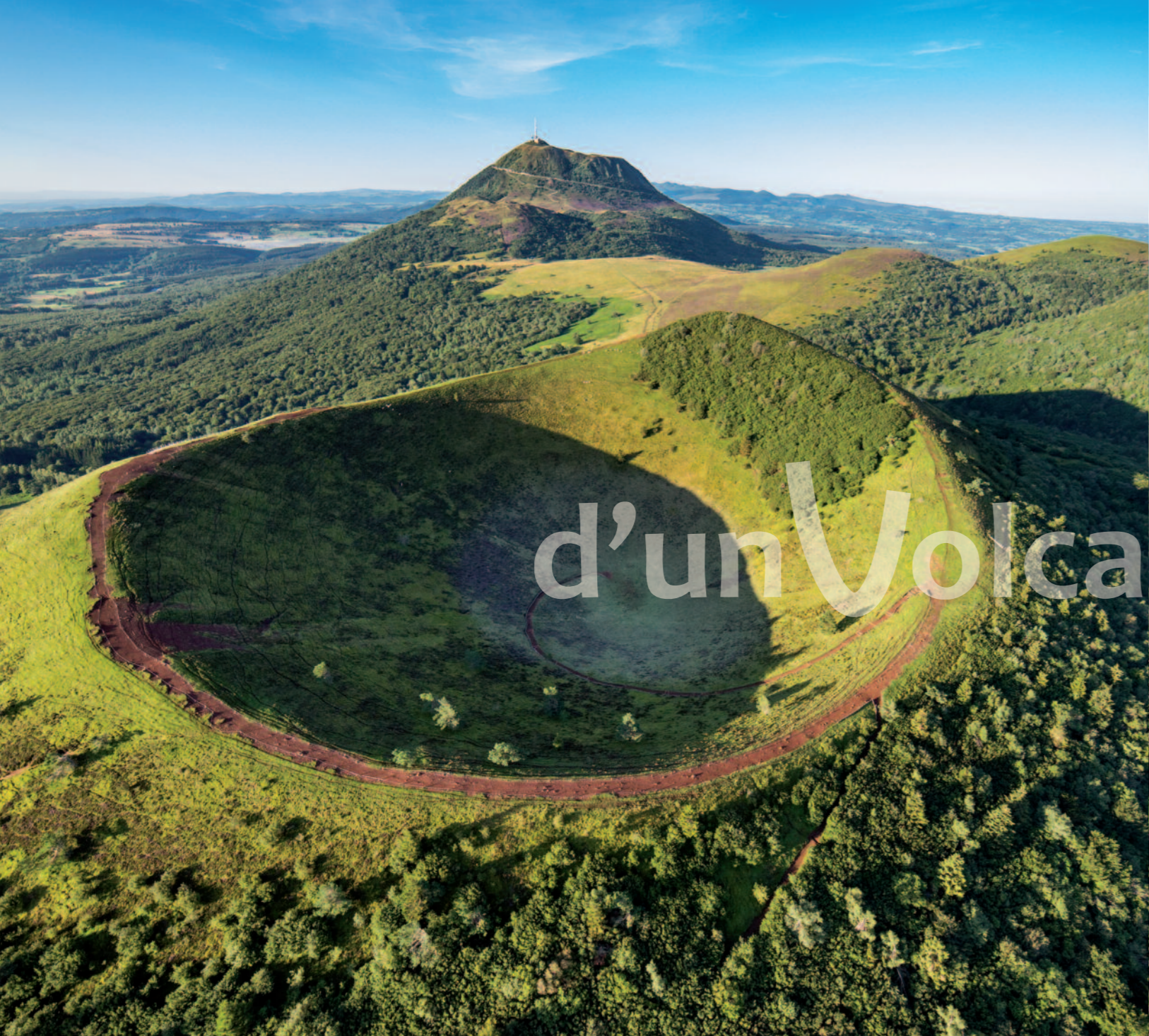
Puy Pariou et puy de Dôme