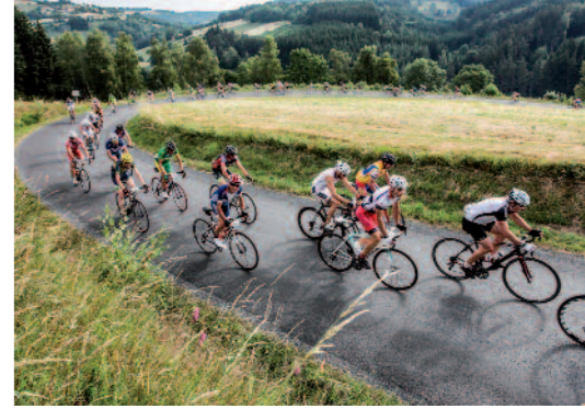
Course Cyclo Les Copains dans le Livradois-Forez

Autour des éléments des volcans : terre, eau, air ou neige, découvrez des activités outdoor : randonnée à pied, à vélo ou VTT, à cheval. En pratiquant le trail, le canyoning dans des rivières sauvages, le ski, l'escalade, le parapente, la nature de l'Auvergne satisfait tous les goûts, les âges et les niveaux ! Une grande variété d'activités propices à la découverte du territoire et des Hommes qui le font vivre.