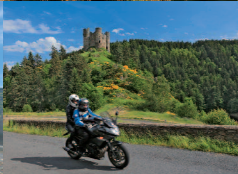
Château d'Alleuze au bord de la Truyère