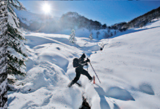
Domaine nordique Puy Mary - Col de Serre