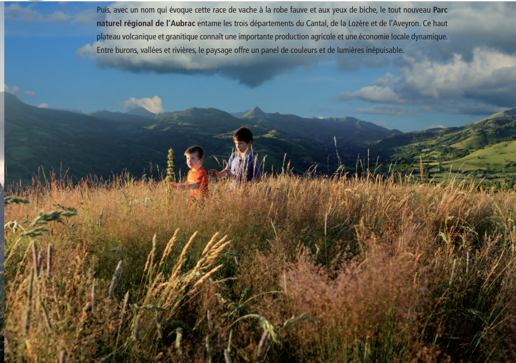
Vallée de la Cère et Puy Griou