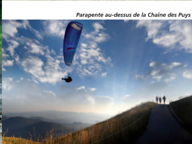
Parapente au-dessus de la Chaîne des Puys