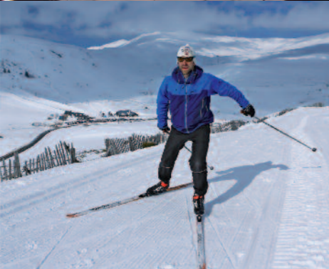
Domaine Nordique de Prat de Bouc en Haute Planèze