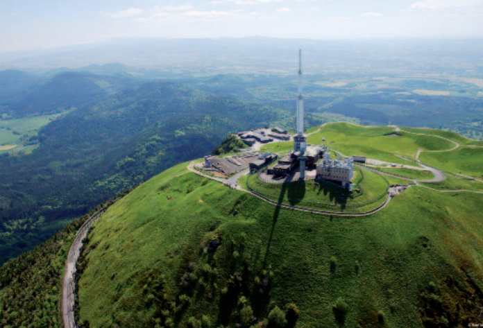
Panoramique des Dômes et temple de Mercure