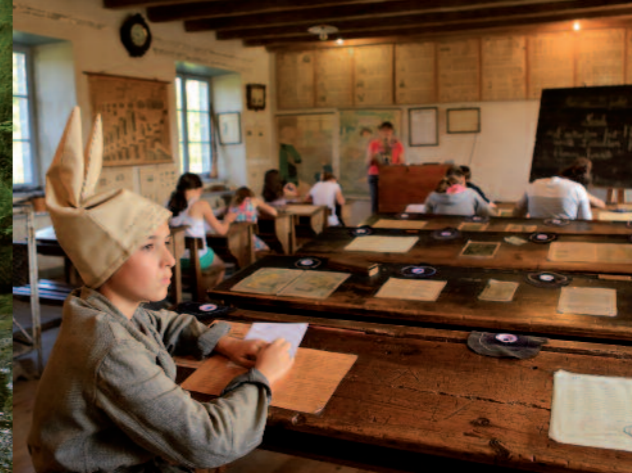
Ecomusée de la Margeride