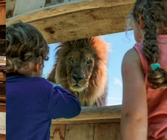
Parc animalier d'Auvergne

Faire l'expérience d'une éruption volcanique, revivre l'épopée de l'invention du pneu, apprendre à fabriquer son propre couteau ... et si on profitait des vacances pour étancher la soif de découverte des petits comme des grands curieux ?