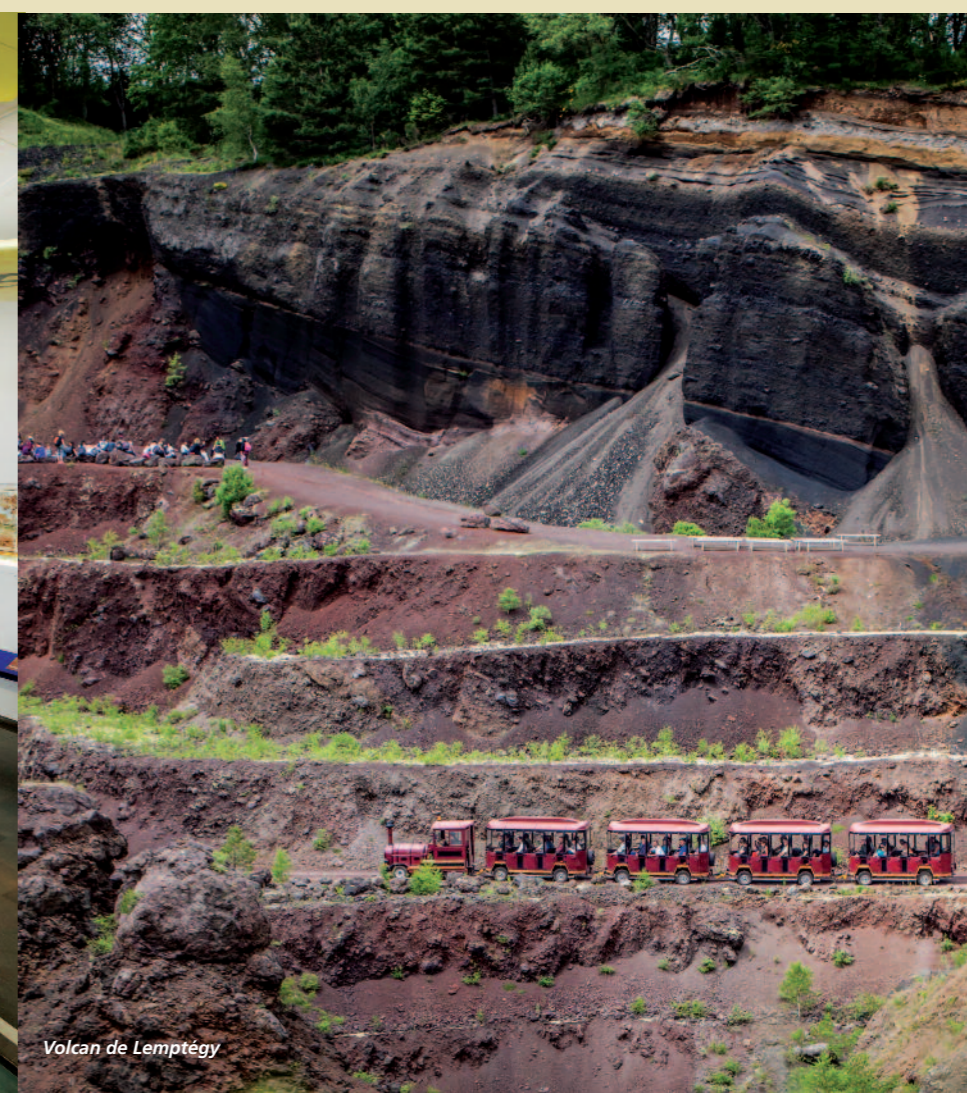
Volcan de Lemptégy