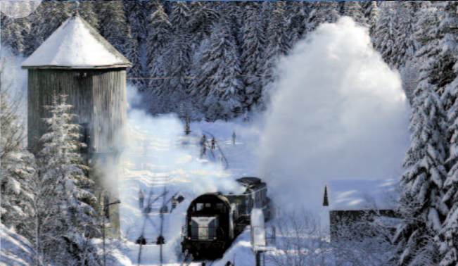
Gare du Lioran, au pied des pistes