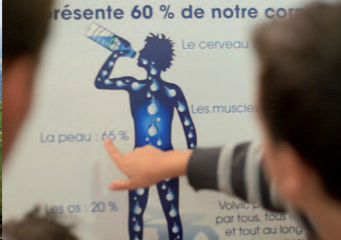
Site des sources de Volvic