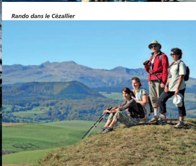
Rando dans le Cézallier