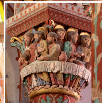
Abbatiale Saint-Austremoine à Issoire