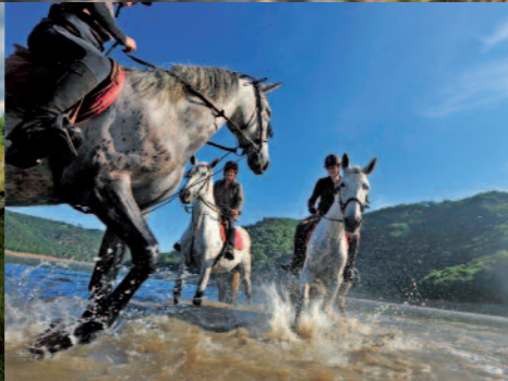
Lac des Fades-Besserve dans les Combrailles