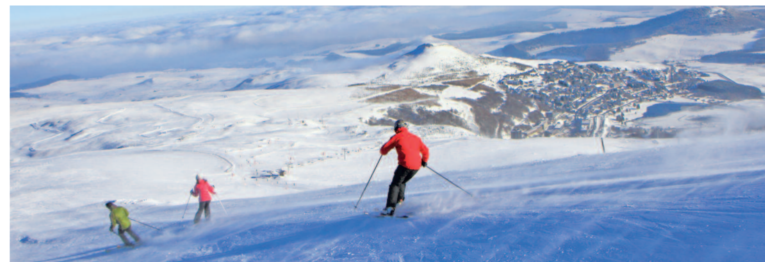
Station de Super-Besse

Glissez sur les volcans et profitez d'une offre de loisirs très diverse : ski de descente, ski de fond, chiens de traîneau, luge ou nouvelles glisses pour plus de fun. Les monts du Cantal (1 850 mètres) ou encore le massif du Sancy (1 886 mètres) réunissent les stations du Lioran, de Super-Besse, du Mont-Dore et de Chastreix, idéales pour des vacances entre amis ou en famille. Les espaces nordiques du Lioran, du Sancy comme des monts du Forez plairont aux adeptes des balades en raquettes et aux amoureux de la nature.