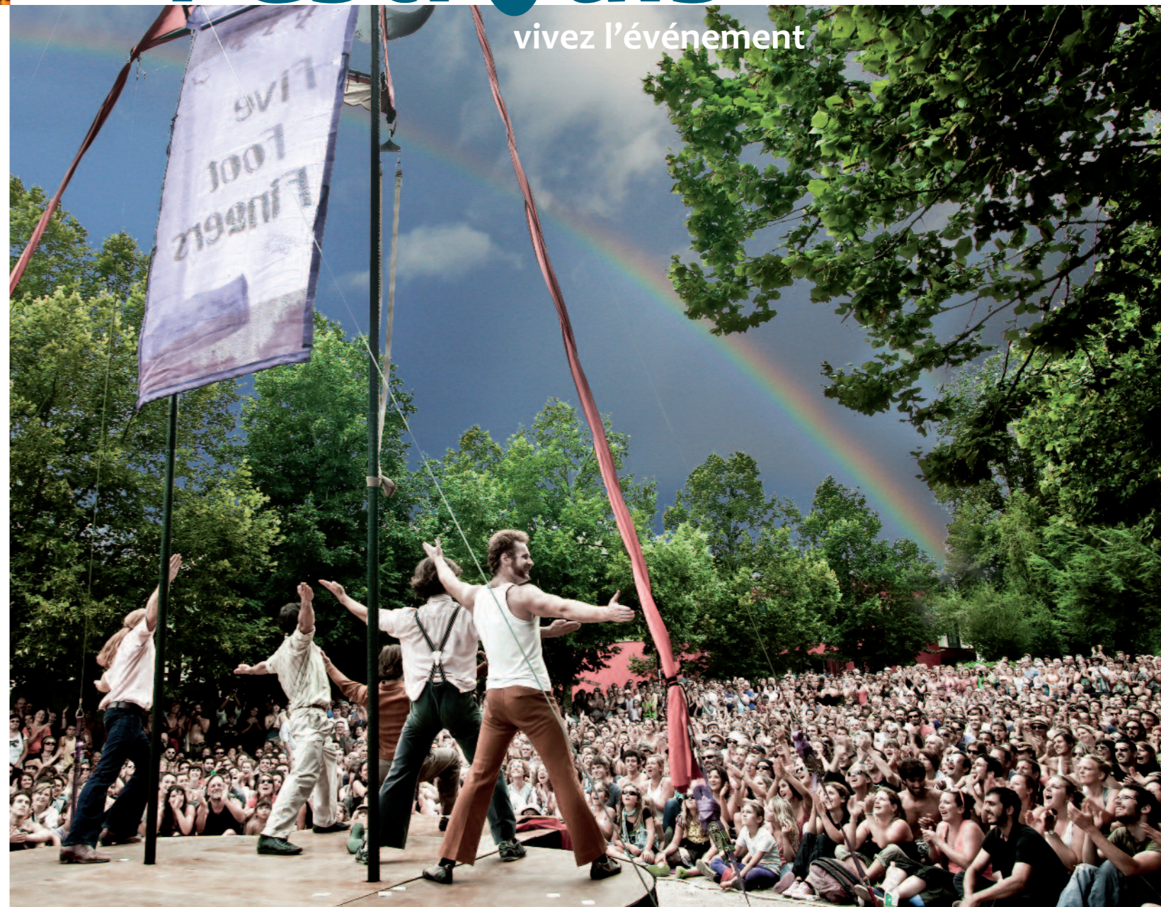
Festival d'Aurillac - Théâtre de Rue