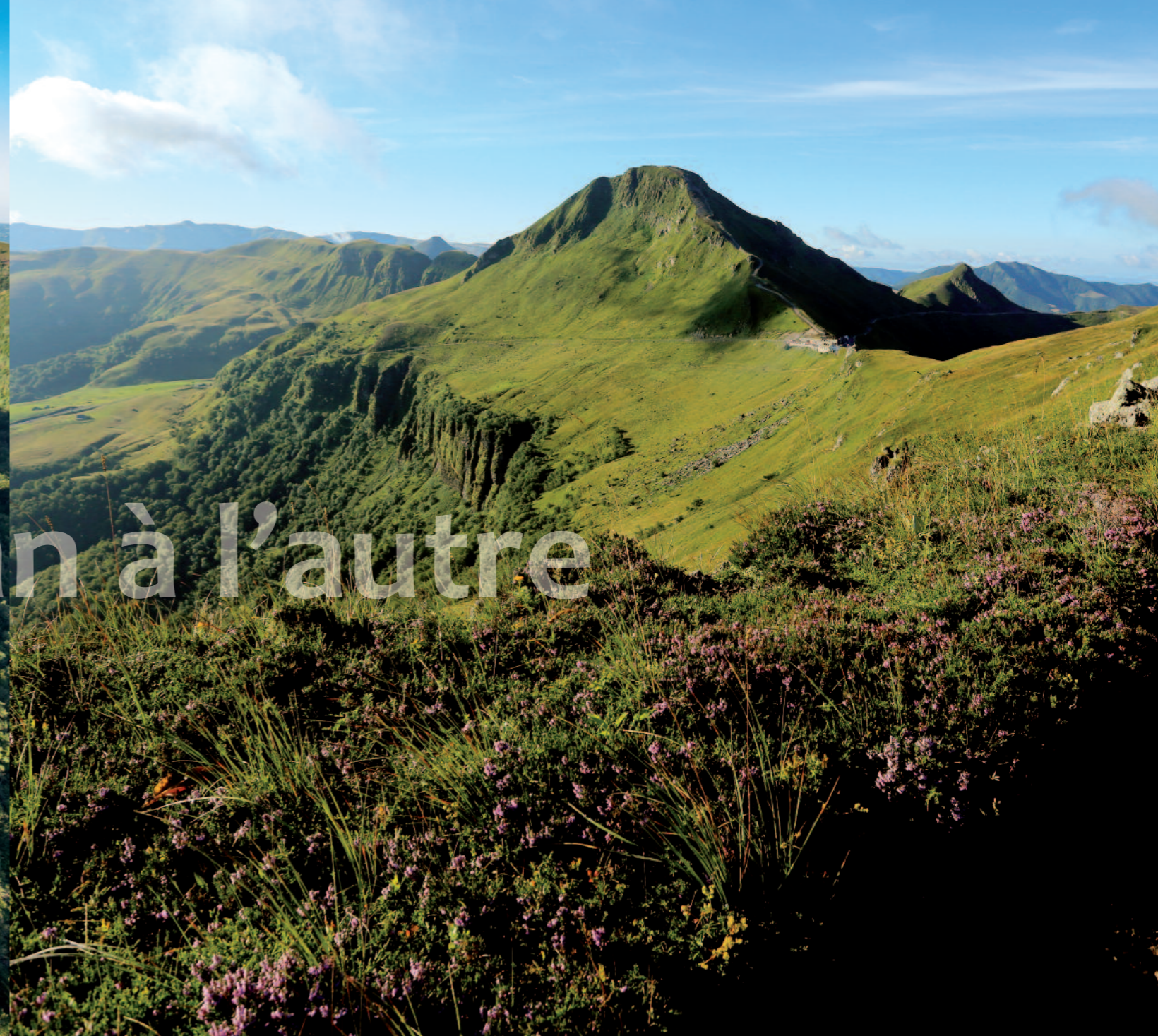
Puy Mary - Volcan du Cantal