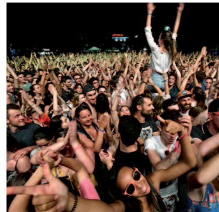
Festival Europavox à Clermont-Ferrand