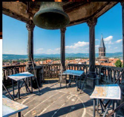
Tour de l'Horloge de Riom