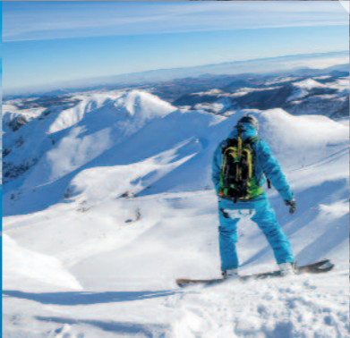
Descente du Sancy