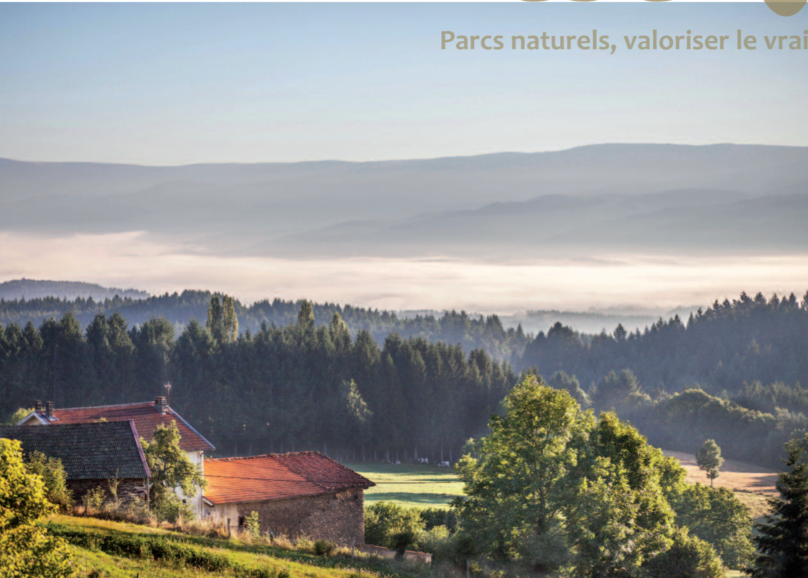
Vallée de la Dore