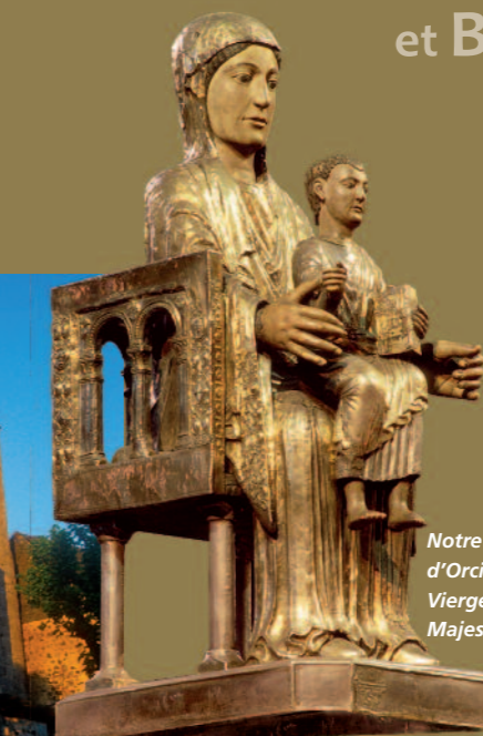
Notre Dame d'Orcival Vierge en Majesté