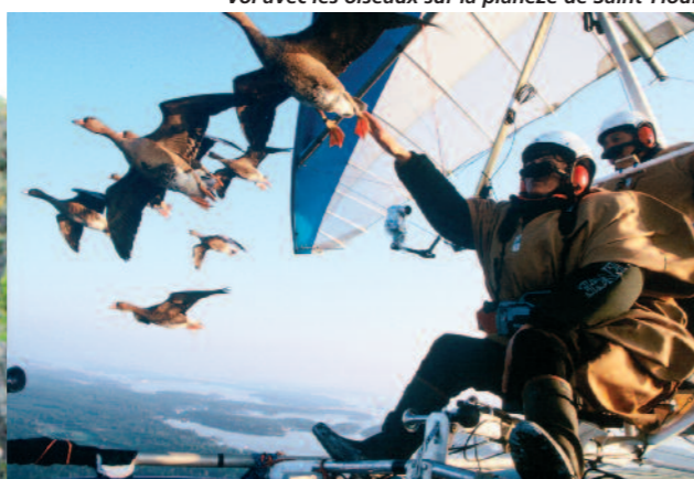
Vol avec les oiseaux sur la planèze de Saint-Flour