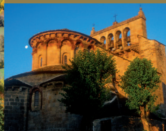
Église romane de Saint-Urcize