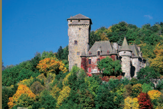
Château de Pesteils à Polminhac