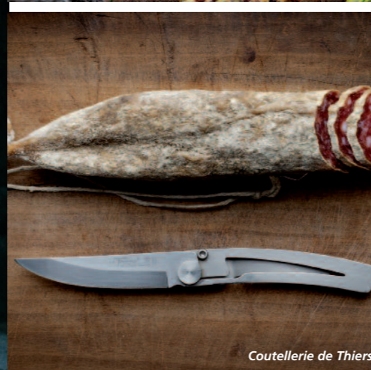
Coutellerie de Thiers