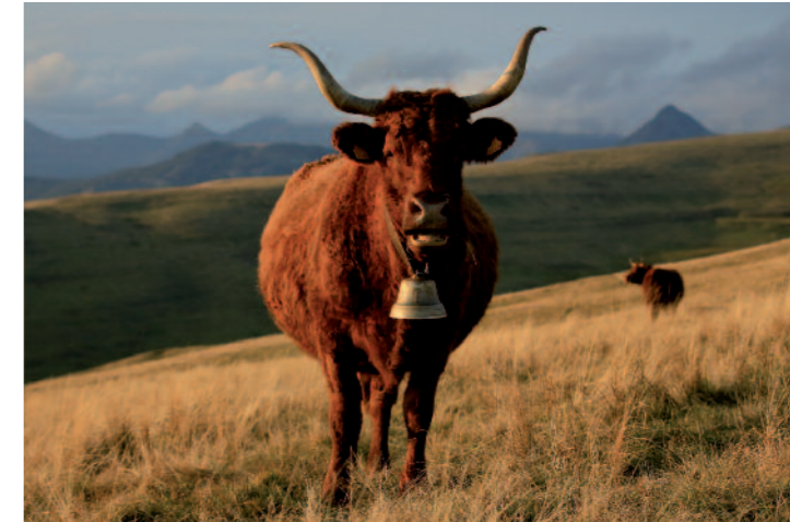
La vache Salers