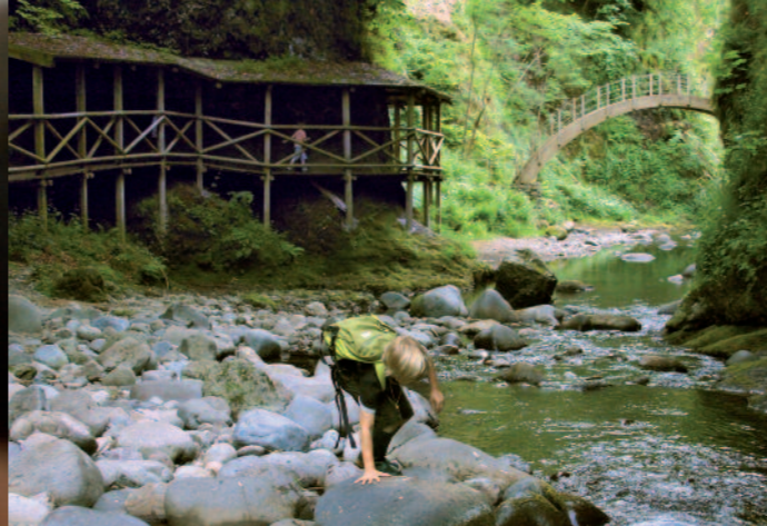
Circuit des gorges de la Jordanne