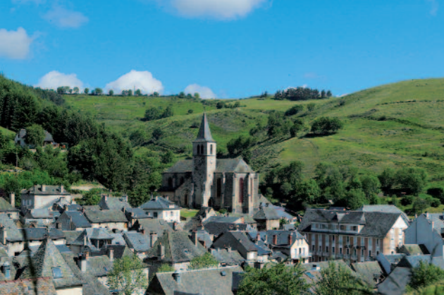
Chaudes-Aigues, les eaux les plus chaudes d'Europe - 82°

La Bourboule Châteauneuf-les-Bains Châtel-Guyon Chaudes-Aigues Le Mont-Dore Royat-Chamalières