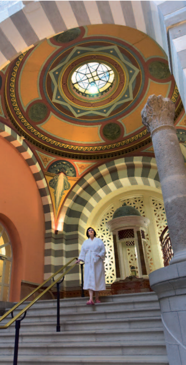
Station Thermale du Mont-Dore

Suivez la Route des Villes d'Eaux et faites étape dans l'un de ces joyaux architecturaux pour profiter des bienfaits de l'eau thermale.