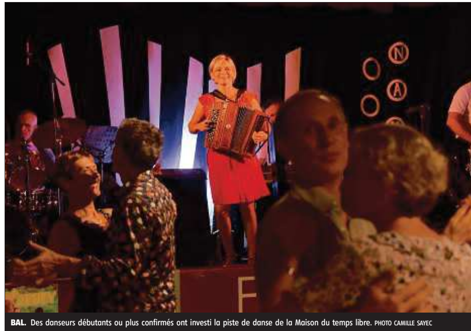
BAL. Des danseurs débutants ou plus confirmés ont investi la piste de danse de la Maison du temps libre.

Beaucoup d'entre eux, d'ailleurs, n'en sont pas à leur première édition.