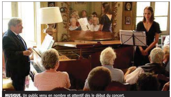
MUSIQUE. Un public venu en nombre et attentif dès le début du concert.