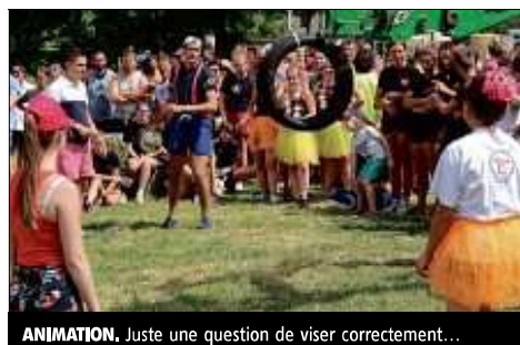
ANIMATION. Juste une question de viser correctement...