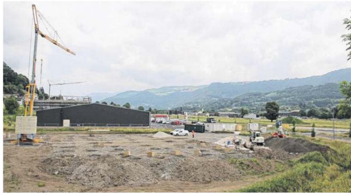
La zone d'activités de Comblat commence à sortir de terre.

Cette nouvelle zone, qui atteindra son plein potentiel d'ici la fin d'année 2020, début 2021 fut initiée pour répondre à un besoin, formulé au départ par des artisans, des entreprises extérieures, mais aussi par le Casino et l'Intermarché présents sur la commune. Pour le Casino, ce dernier souhaitait réaliser un nouvel ensemble, plus moderne avec de nouvelles installations. Une condition sine qua non à sa présence sur la commune de Vic,