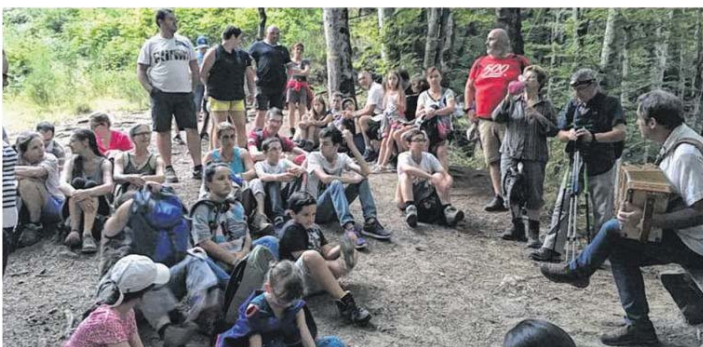
Son talent de conteur saura captiver son auditoire à la découverte de ce site exceptionnel.

Carladès Abans propose cet été une série d'animations et de spectacles autour de la culture occitane pour les habitants et les visiteurs du Carladès.