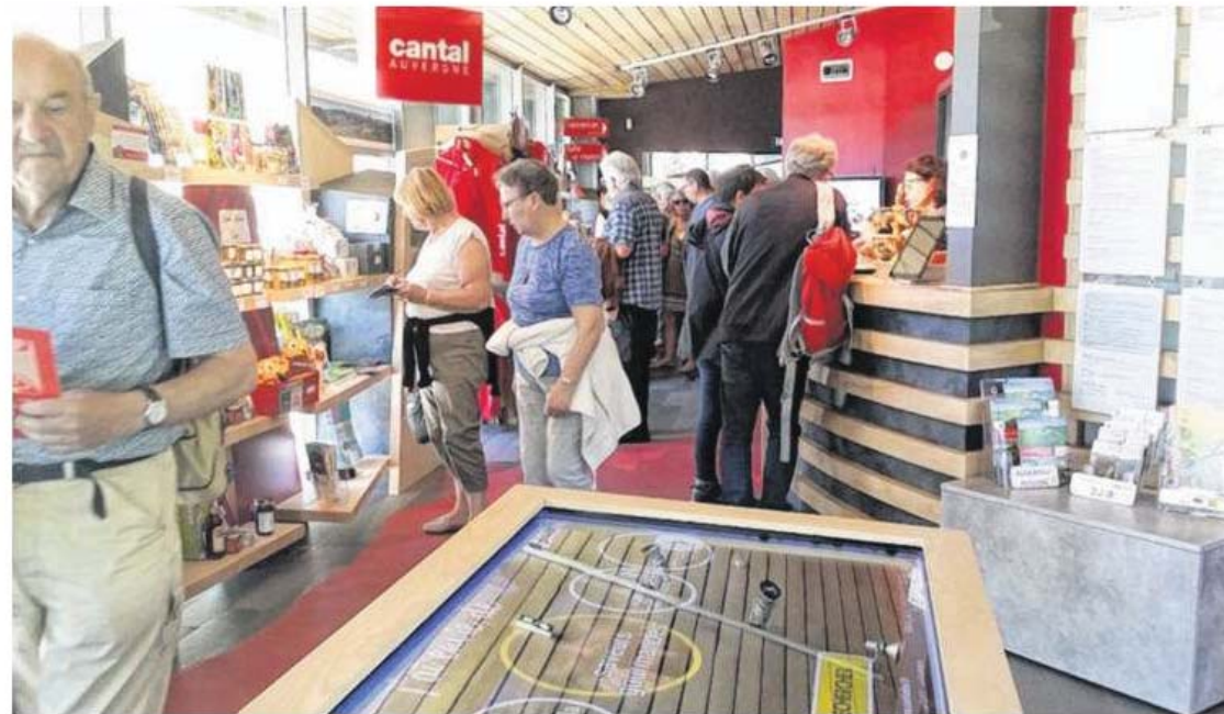
L'office de tourisme est le maillon central et le poumon de la promotion de ce territoire.

Mais aussi poursuite des projets participatifs avec les habitants pour valoriser des sites du Carladès, apporter du contenu et une plus-value à la découverte : à titre d'exemples, travail avec un géologue sur la coulée de lave du Rocher des Pendus