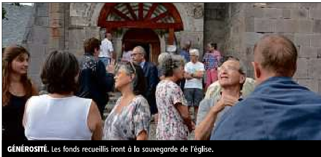
GÉNÉROSITÉ. Les fonds recueillis iront à la sauvegarde de l'église.

Cette manière originale de découvrir le territoire, mise en place par la pastorale du tourisme de la paroisse Saint-Jacques Berthieu, avec le soutien de la communauté de communes et de l'office intercommunal de tourisme, était au service de la collecte de fonds, réalisée